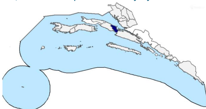
SLIKA 3. POLOŽAJ OPĆINE JANJINA U DUBROVAČKO-NERETVANSKOJ ŽUPANIJ

Općina Janjina dio je megaregije jadranske Hrvatske kojoj pripada i županija Dubrovačko-neretvanska. U užem smislu ona je dio jugoistočne dalmatinske makroregije s arhipelagom. Južna Dalmacija je najmanji, najuži i najrjeđe naseljeni dio megaregije (županija Dubrovačko-neretvanska po gustoći je