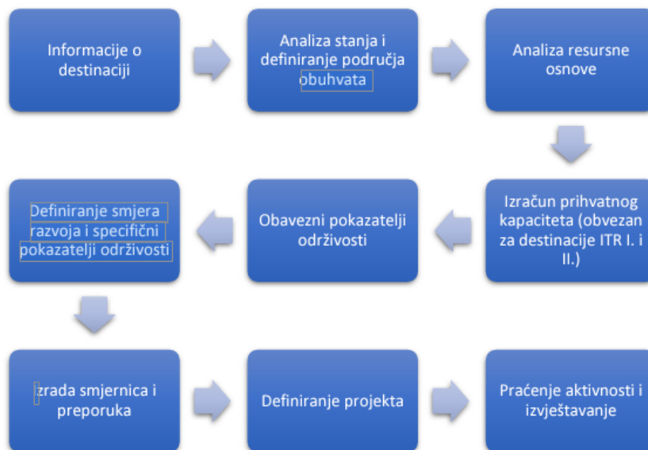
SLIKA 2. IZRADA PLANA UPRAVLJANJA DESTINACIJOM

Metodološki pristup osmišljen je tako da se osigura zastupljenost svih relevantnih dionika u procesu izrade Plana, kako bi se osigurala kontinuirana informiranost i podrška za implementaciju. Uključenost dionika osigurana je provođenjem dubinskih intervjua s predstavnicima dionika koje Naručitelj identificira kao ključne za razvoj turizma na području općine Janjina te kroz prezentaciju rezultata Studije i Akcijskog plana širokom spektru dionika. Prema propisanim Smjernicama, Plan se izrađuje prema slijedećem planu, s iznimkom preskakanja koraka 4. jer općina Janjina nije destinacija I. ili II. razine turističke razvijenosti, odnosno pripada III. razini razvijenosti.